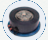
有框直接驱动旋转电机