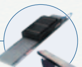
直接驱动直线电机