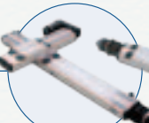
多轴精密定位平台