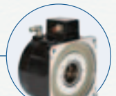
模块化直接驱动旋转电机